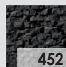
452 Antracita / Anthracite