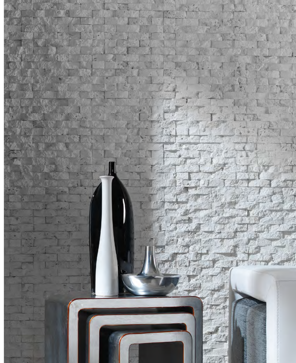
PR 451 Blanco Italia