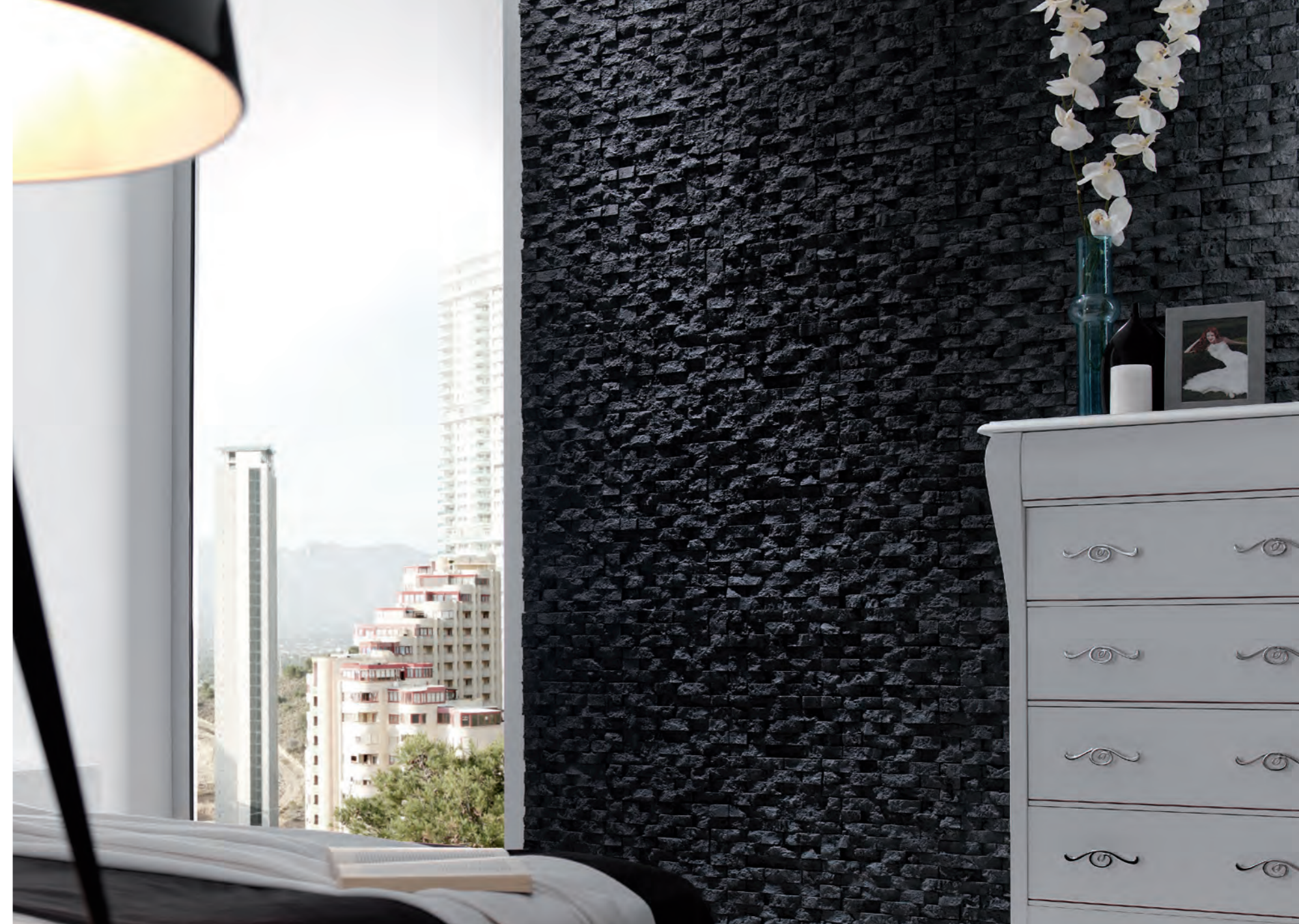
PR 452 Antracita