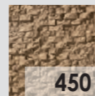
450 Ochre / Ochre